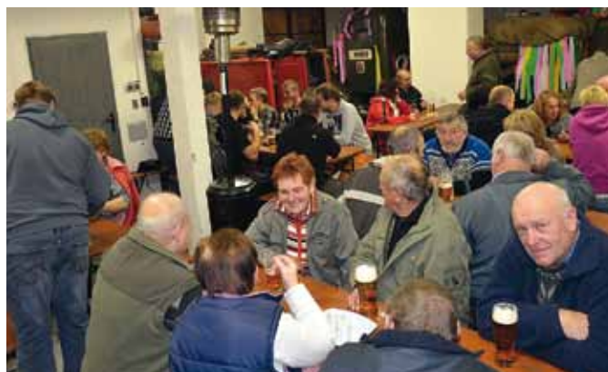
Ukončení sezóny v hasičárně

Před samotnou akcí jsme se ale neflákali a odpoledne jsme ještě kromě přípravy akce vyplnili i zazimování techniky a úklidem hasičárny. Zásahovou techniku jsme ale před zimou vyvětrali ještě jednou a to přesně o týden později. Čekalo nás totiž pravidelné námetové cvičení našeho okrsku.