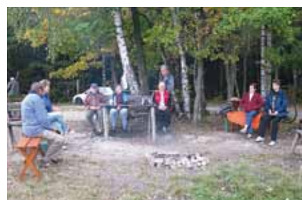
Táboráček na Mariánské hoře