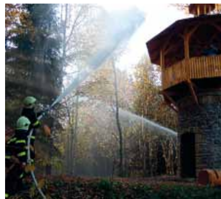
Námětové cvičení – Rozhledna Hlásky nad lanškrounskou sjezdovkou