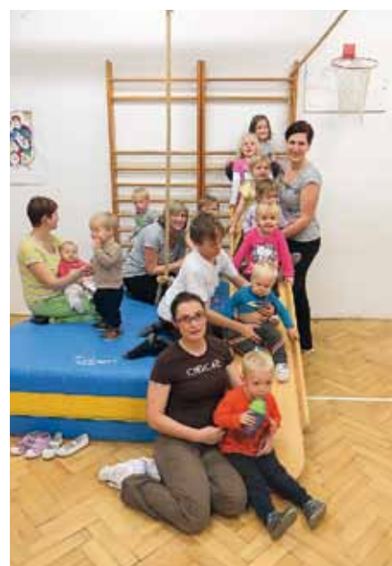
Cvičení rodičů s dětmi