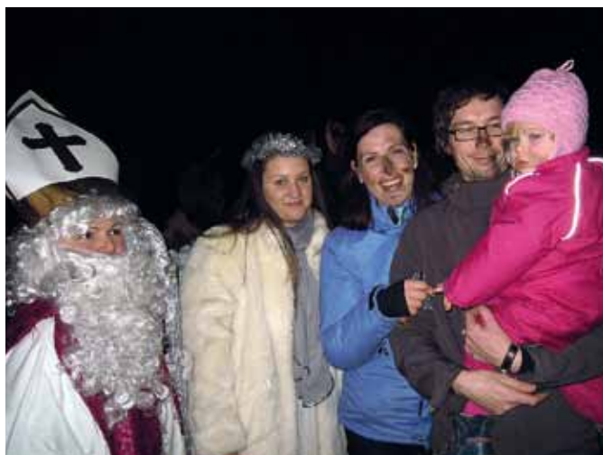
Čertovská družina čerta Belzebuba