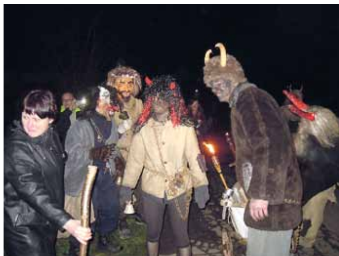
Čertovská družina čerta Belzebuba