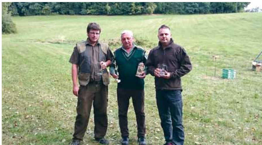
Střelby MS TH