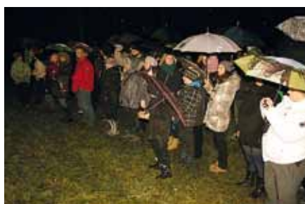
Vánoční slavnosti