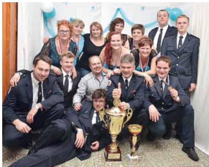
Slavnostní vyhlášení VČÚ 2015