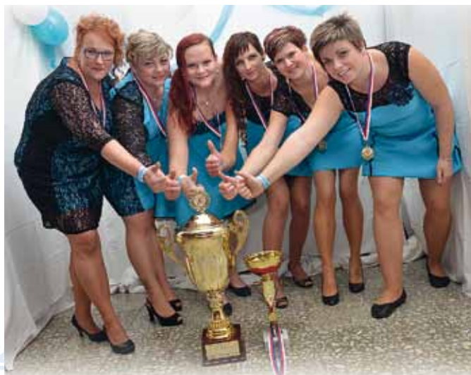
Vítězky VČÚ 2015