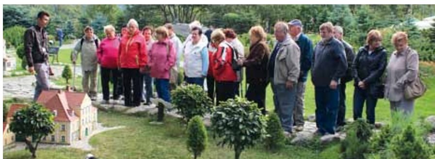
Muzeum miniatur