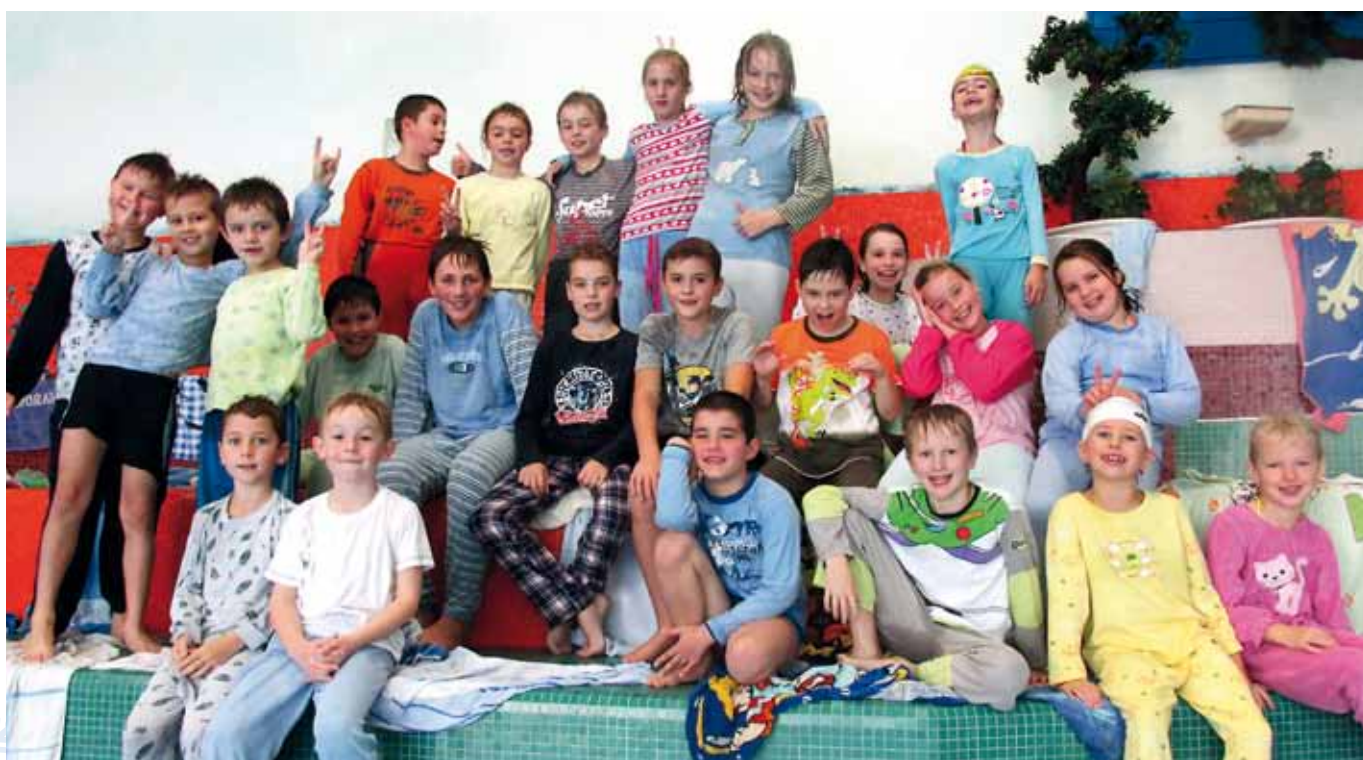
Radovánky ve vodě – plavání v pyžamu.