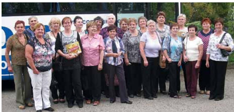
Výlet na muzikál Děti ráje